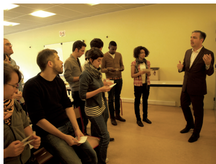
Des élèves lors d'une master-class de l'auteur de bande dessinée Matt Madden